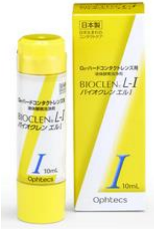
バイオクレンエル I 10ml