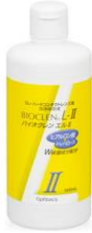
バイオクレンエル II 360ml